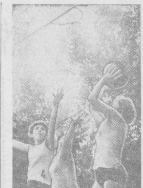
В Ташкенте началась соревновательная баскетбольная программа XII спартакиады Узбекистана. Игры проходят в упорной борьбе за первенство.