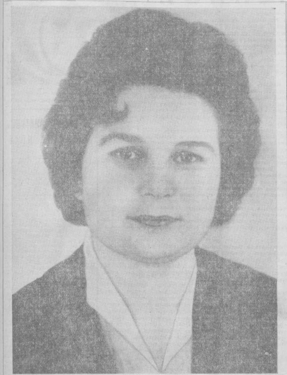
Валентина Владимировна ТЕРЕШКОВА.