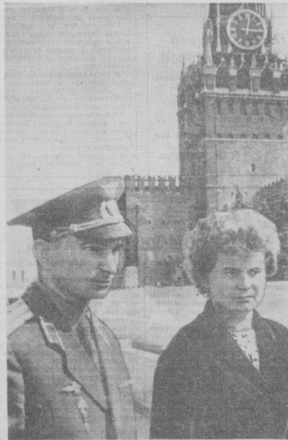
Незадолго перед стартом во Вселенную Валерий Быковский и Валентина Терешкова, по традиции советских космонавтов, вместе пришли на Красную площадь.