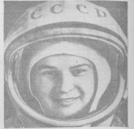
Космонавт-Шестая В. В. Терешкова в скафандре.

В первые сутки своего космического полета Валентина Терешкова передает приветствия народам Китая, Латинской Америки, героическим женщинам Кубы, народам США и Австралии. Настроение у космонавтов бодрое и рабочее. Аппетит и сон хорошие. Пульс Валентины Терешковой 68 ударов в минуту, частота дыхания — 18; у Валерия Быковского пульс 60 ударов в минуту, частота дыхания — 15. Все бортовые системы космических кораблей «Восток-5» и «Восток-6» работают нормально. Давление, температура, влажность и состав воздуха в кабинах кораблей «Восток-5» и «Восток-6» в пределах нормы.