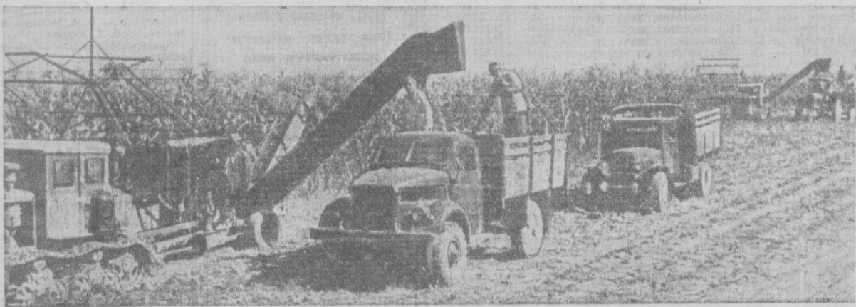
Комбайновая уборка кукурузы в колхозе «Кызыл Узбекистан» Калининского производственного управления.