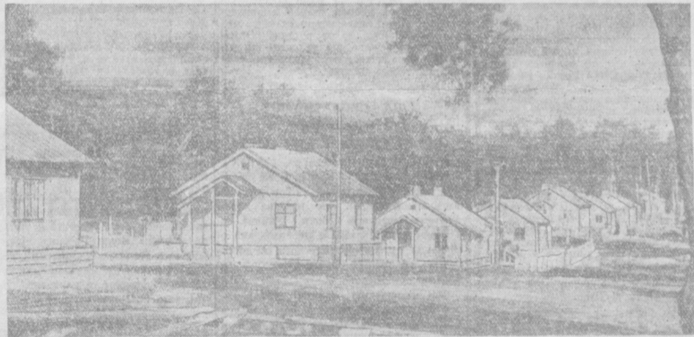
Первыми выросли на строительной площадке Куйбышевгидростроя поселки строителей ГЭС и подсобные предприятия, в том числе механические мастерские и лесозаводы. На снимке: поселок строителей в сосновом бору. Во всех новых домах имеются электричество и радио.

Домостроительные заводы и комбинаты Министерства промышленности строительных материалов СССР досрочно изготовили и отгрузили в адрес Куйбышевгидростроя 120 восьмиквартирных и 210 одноквартирных сборных домов.