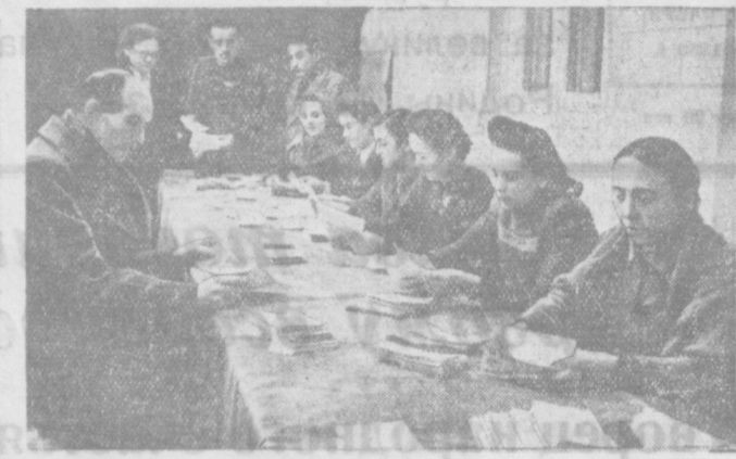
Подсчет голосов участковой избирательной комиссией 255-го избирательного участка Центрального района Ташкента.