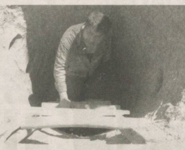
«Кудук» филмидан лавҳа.

Ёзувчи Гафур Шермухаммаднинг «Кудук» қиссаси ўтган йилнинг энг яхши асари сифатида эътироф этилди, жумладан, «Шарқ юлдузи» журнали йиллик танловининг насл йўналишининг ёлиби сифатида тақдирланди. Табиийки, шу қисса асосида яратилган баъдий филм тақдироти ҳам жамоатчиликнинг диққат эътиборида бўлди.