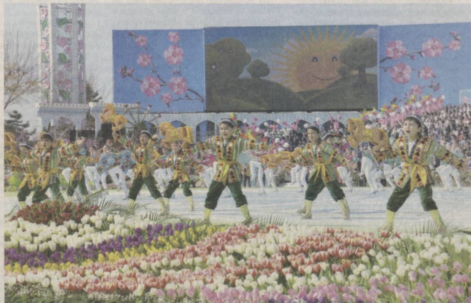
Алишер Навоий номидаги Ўзбекистон Миллий боғида бўлиб ўтган Наврўз байрами тантаналаридан лавҳа.