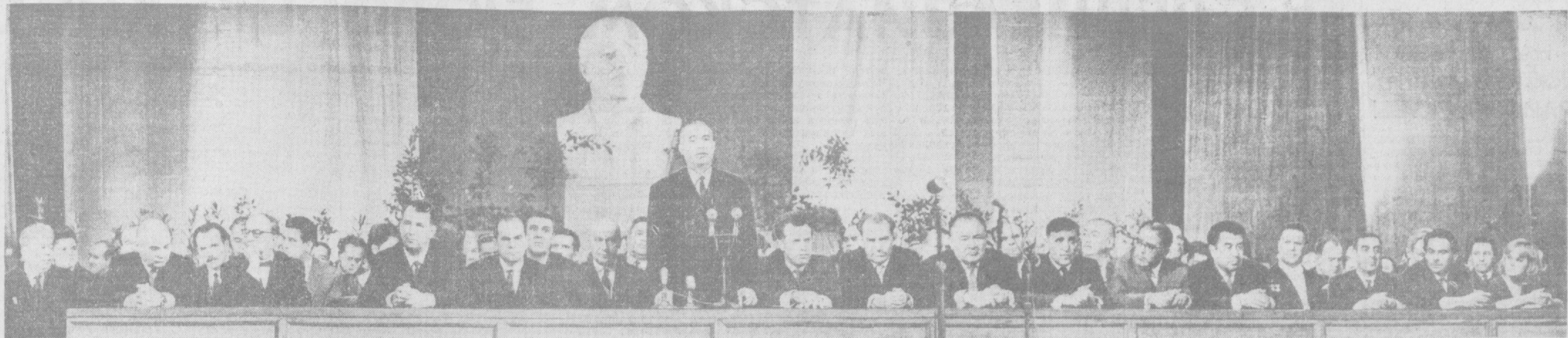
Театр имени Навои. Торжественное заседание. Гости приглашены в президиум. Декада открыта!