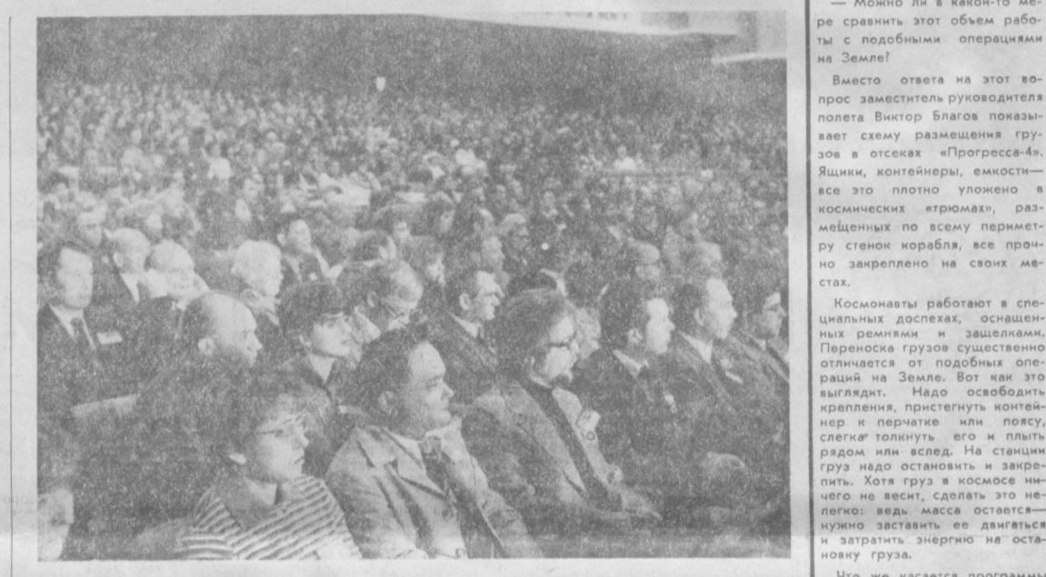
В зале заседаний симпозиума.

Получив три года назад приглашение АН СССР на симпозиум, который должен был проходить в Советском Союзе, я был весьма обрадован перспективой вновь посетить вашу страну и встретиться с коллегами — учеными из СССР. Со многими из них я познакомился семнадцать лет назад, во время Московского симпозиума по макромолекулярной химии, и тогда