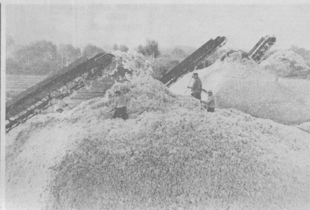
Почти тысячу гектаров занимают посевы хлопчатника в колхозе имени Кирова Янгйерского района. С каждого гектара земледельцы решили собрать нынче по 45 центнеров сырья. На снимке: непрерывным потоком идет хлопок с поля хозяйства на Янгйерский заготовительный пункт.