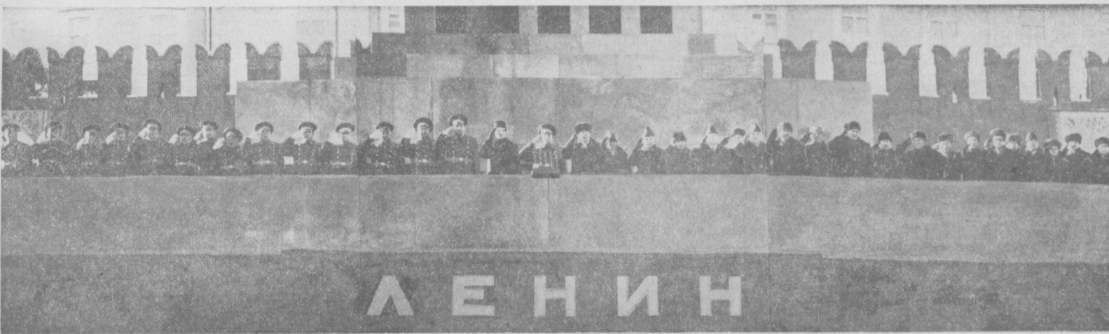
Москва. Красная площадь. Военный парад и демонстрация представителей трудящихся, посвященные 61-й годовщине Великой Октябрьской социалистической революции. На снимке: на трибуне Мавзолея В. И. Ленина.

ОРГАН ЦК КОМПАРТИИ УЗБЕКИСТАНА, ВЕРХОВОГО СОВЕТА И СОВЕТА МИНИСТРОВ УЗБЕКСКОЙ ССР № 256 (18836) Среда, 8 ноября 1978 года Цена 2 коп.