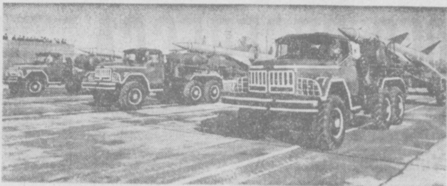
Военный парад в Ташкенте.