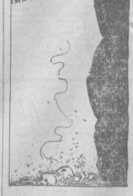
Над пропастью... Рис. И. ЛЕУШИНА

Инфляция подталкивает на повышение цен. Вискоминку. Она оборачивается крахом для многих банков и фирм западного мира. (Из газет.)