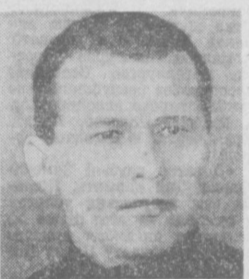
беседовал с руководителями, рабочими, знал нужды и заботы строителей.