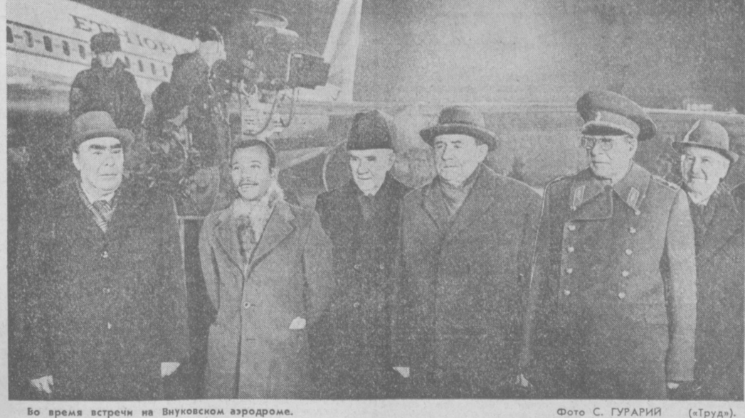
Во время встречи на Внуковском аэродроме.

По приглашению Президиума Верховного Совета СССР и Советского правительства 16 ноября в Москву с официальным дружественным визитом прибыл Председатель Временного административного совета и Совета министров Социалистической Эфиопии подполковник Менгисту Хайле Мариам. На Внуковском аэродроме, украшенном государственными флагами Социалистической Эфиопии и Советского Союза, у трапа самолета Менгисту Хайле Мариам тепло приветствовали Генеральный секретарь ЦК КПСС, Председатель Президиума Верховного Совета СССР Л. И. Брежнев, член Политбюро ЦК КПСС, Председатель Совета Министров СССР А. Н. Косыгин, член Политбюро ЦК КПСС, министр иностранных дел СССР А. А. Громыко, член Политбюро ЦК КПСС, министр обороны СССР Маршал Советского Союза Д. Ф. Устинов, кандидат в члены Политбюро ЦК КПСС, первый заместитель Председателя Президиума Верховного Совета СССР В. В. Кузнецов, кандидат в члены Политбюро ЦК КПСС, секретарь ЦК КПСС Б. Н. Пономарев, другие официальные лица. На летном поле был выстроен почетный караул. Л. И. Брежнев и Менгисту Хайле Мариам обменялись советскими орденами. Были исполнены Государственные гимны Социалистической Эфиопии и Советского Союза. Улицы и площади столицы, по которым высокий гость из Эфиопии и советские руководители следовали в сопровождении почетного эскорта мотоциклистов, были украшены государственными флагами двух стран, приветственными транспарантами. (ТАСС).