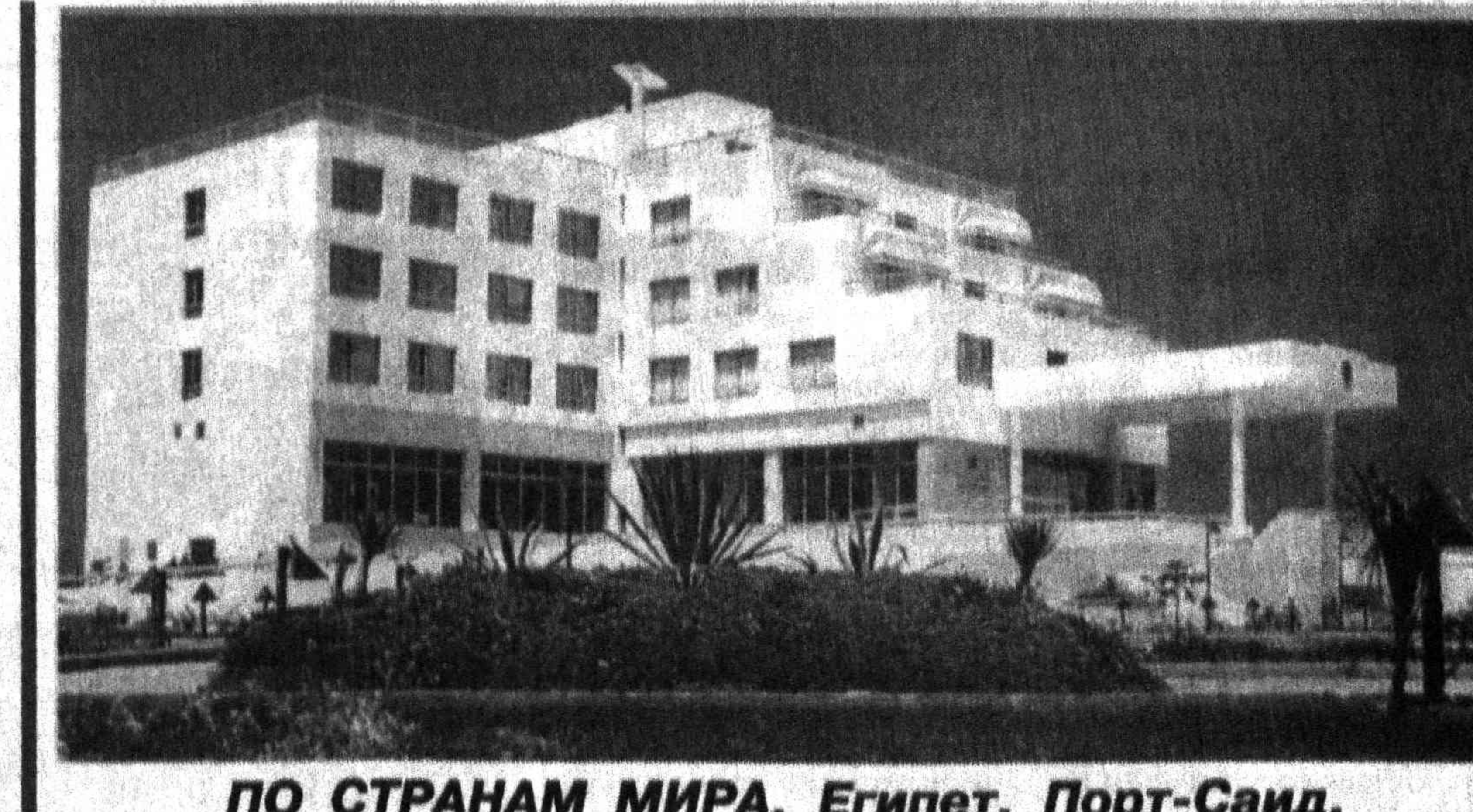
ПО СТРАНАМ МИРА. Египет. Порт-Саид.

дов меньше, чем было в прошлом году. Что же касается богатейших людей России, то здесь на первом месте глава нефтяной компании «ЮКОС» Михаил Ходорковский. От Билла Гейтса его отделяет список из 100 человек. Всего американский журнал назвал 7 россиян среди богатейших людей планеты.