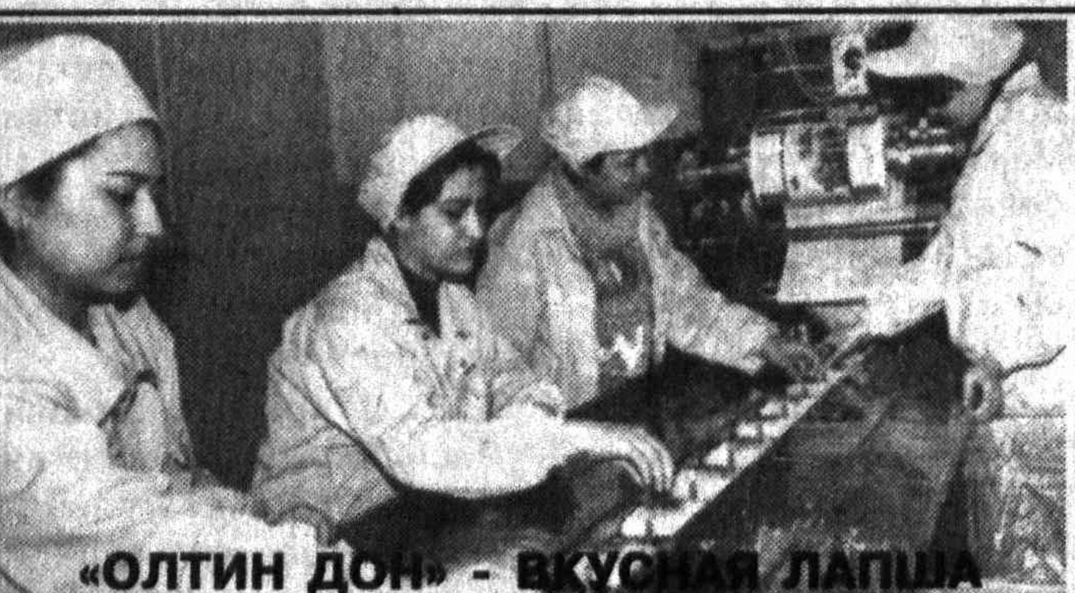
«ОЛТИН ДОН» - ВКУСНАЯ ЛАПША 150 тысяч пакетов лапши быстрого приготовления в сутки - такова мощность совместного узбекско-китайского предприятия «Олтин Дон», расположенного в Янгиоле. Выпускаемые здесь 6 видов лапши уже прекрасно зарекомендовали себя на узбекском рынке, так что в планах СП - расширить ассортимент и увеличить объем производства. Совместное предприятие позволило создать 80 рабочих мест. Здесь трудится в основном молодежь. На снимке: продукция СП проходит строгий контроль.