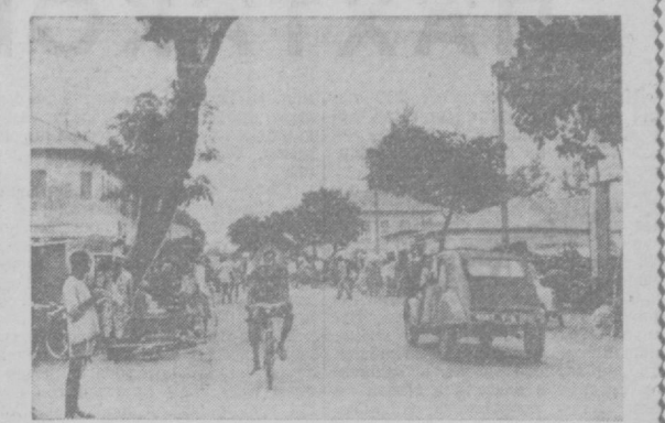
Молодая африканская республика Дагомея стала независимой в 1960 году. В настоящее время здесь миллионы людей. На снимке: улица столицы Дагомеи — города Порто-Ново.

В настоящее время министерство юстиции намерено возобновить процесс над Коммунистической партией США на основании фашистского закона Манкандера.