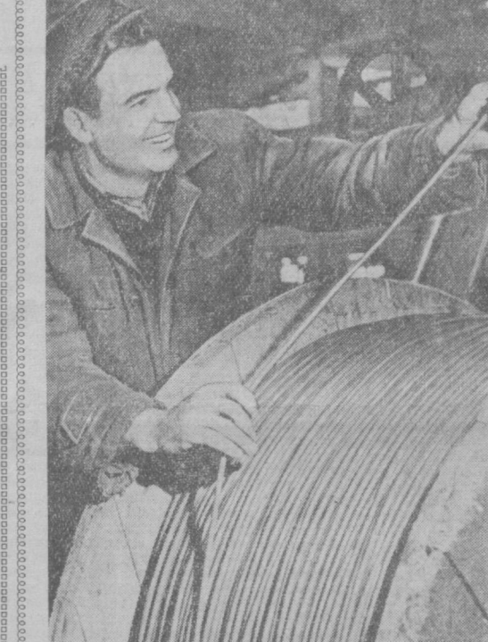
На призы москвичей и ленинградцев выпускает продукцию, отвечающую требованиям лучших отечественных и зарубежных станочников, общими из первых в нашей республике отключились производственные цеха «Ташкенткабеля».