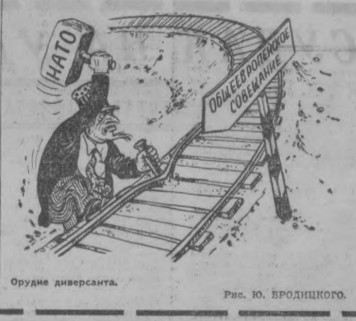
Орудие диверсанта. Рис. Ю. БРОДИЦКО.

РИМ, 6 января. (ТАСС). Итальянская полиция и органы юстиции продолжают расследование обстоятельств взрыва бомб, подложенных террористами в Милане и Риме в декабре минувшего года. Их работа осложнена завесой секретности. Объявлено только, что официальное обвинение в организации и подготовке террористических