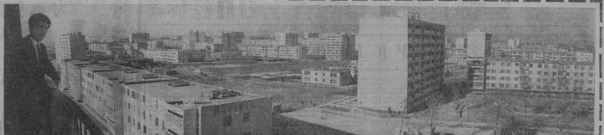
Великая Родина — Ташкенту!