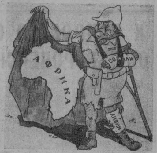
Колониализм: «Да, такую диру не заштопаешь». Рис. Ю. ВРОДИЦКОГО.

▲ «Утечка умов» из Италии продолжается. За период с 1963 по 1968 год в США эмигрировало из Италии в общей сложности 10,006 научных работников, технических инженеров и высококвалифицированных специалистов.