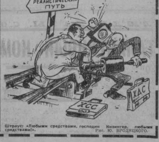
Штраус: «Любимыми средствами, господам Инзингер, любящим средствами!»