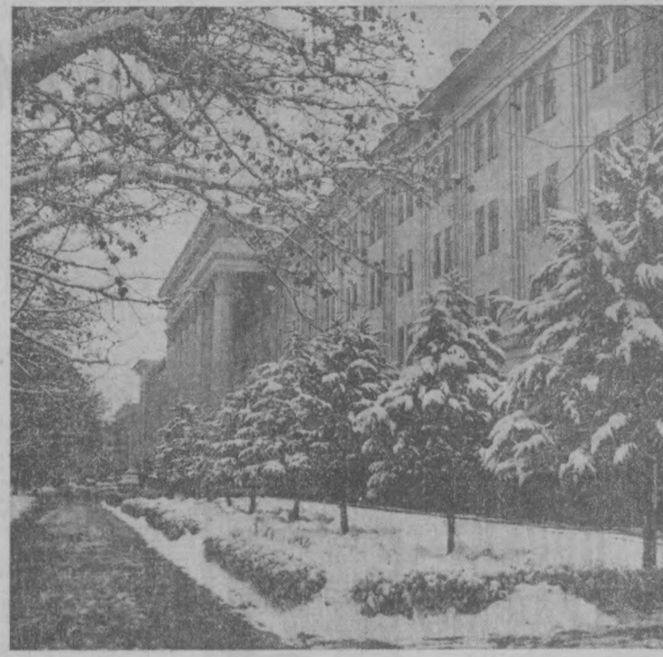
ЗИМНЯЯ ТАШКЕНТ. Улица Навои.