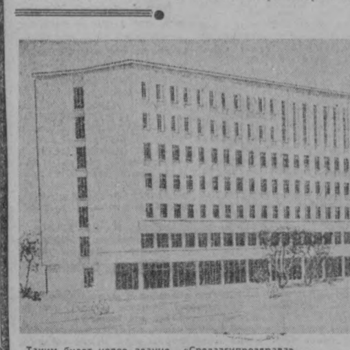
Таким будет новое здание «Среднеазиатздрав».