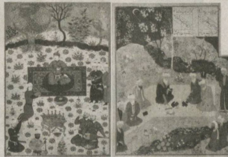
каби миниатюралар шулар жумласидандир.

Ҳаққоний сўзлар "Оқсарой" мажмуаси устидаги изланишларда яққол ифодасини топди.