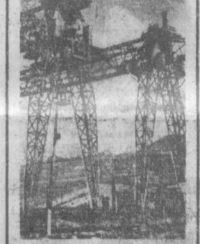
На строительстве Чаранской ГЭС появилась новая техника — козловые краны грузоподъемностью 50 тонн. Они будут разгружать с платформ агрегаты для станции.

● В ЛЕСУ родилась блоха. Эту песенку пели у сверкающей огнями лунной и красивой русской лесу юности и девушки из Демократической Республики Вьетнам и Кубы, Афганистана и Кении, ОАР и Узбекистана. Весело прощались вечером 9 января в Ташкентском Дворце спорта «Шульце» интернациональный студенческий бал. В нем участвовали сотни обучающихся в вузах столицы Узбекистана учащихся спецназначения из 25 стран Азии, Африки и Латинской Америки.