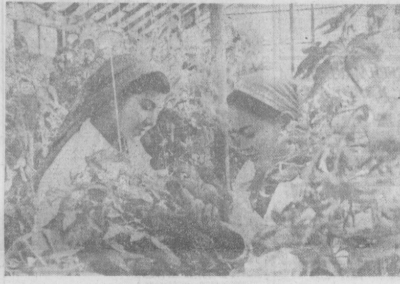
Круглый год снабжает свежими овощами жителей Ташкента тепличный комбинат колхоза имени Карла Маркса...