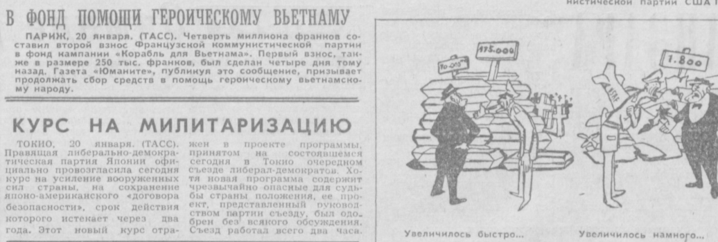
Увеличилось быстро... Увеличилось намного... Стало гораздо больше, чем в прошлом году... А чего-нибудь стало меньше? Да... Безопасных тыловых баз... из журнала «Вьетнам».

ТЕАТР кукол вынес на аршину новый спектакль для взрослых «Гурий Львович Синичкин». Это не пародия на «Льва Гурыча Синичкина». Авторы — Вл. Дьячковский, М. Слободский, Вл. Маси и Мих. Чернышевский — создали на старой сюжетной канве отличную современную комедию, сохраняющую пародийность и остроту. Так и задуман спектакль режиссера Постановки А. Беллинского, режиссеры — И. Якубов и Н. Никифорова.