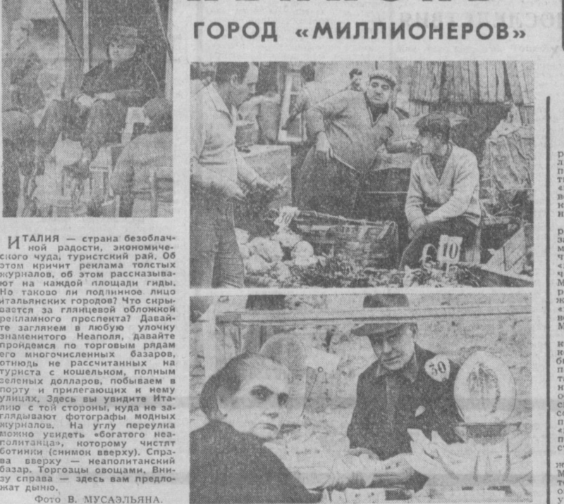
Италия — страна безоблачной радости, экономического чуда, туристский рай. Об этом кричит реклама толстых журналов, об этом рассказывают на каждой площади гиды.