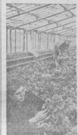
Коллектив 4-го отделения совхоза декоративного цветоводства Ташгорисловского района...

С ЖИЗНЬЮ узбекской столицы ознакомила делегация муниципалитета Кабула, гостившая в Советском Союзе по приглашению Моссовета.