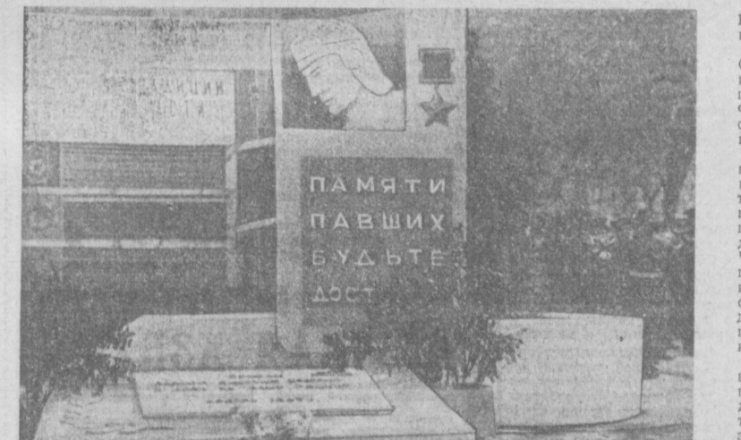
Памятник, поставленный гвардейцами на территории части в память о погибших в годы Великой Отечественной войны.

В БЕЗДОННОМ голубом небе плыли редкие белоснежные облака. Еще не выходящая после недавнего дождя блестящая лента автострады стрелой спускалась в долины и вновь стремительно рвалась к вершинам холмов. Тогда расступился горизонт, открывая во всю ширь простую и пленительную красоту голубовато-изумрудных белорусских долин, позолоченных полуденным солнцем.