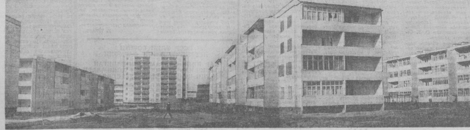
Қорақамиш массиви бунёдкорларининг фидокорона меҳнатлари билан жуда тез кенгайиб ва гўзаллашиб бормоқда. Бу ерда деярли ҳар кун ҳовли тўйлари бўлиб ўтмоқда. Суратда: массивнинг 4-микрорайониди янги турар-жой бинолари.

Матбуот саҳифасида кўпроқ ишлаб чиқариш илгор-