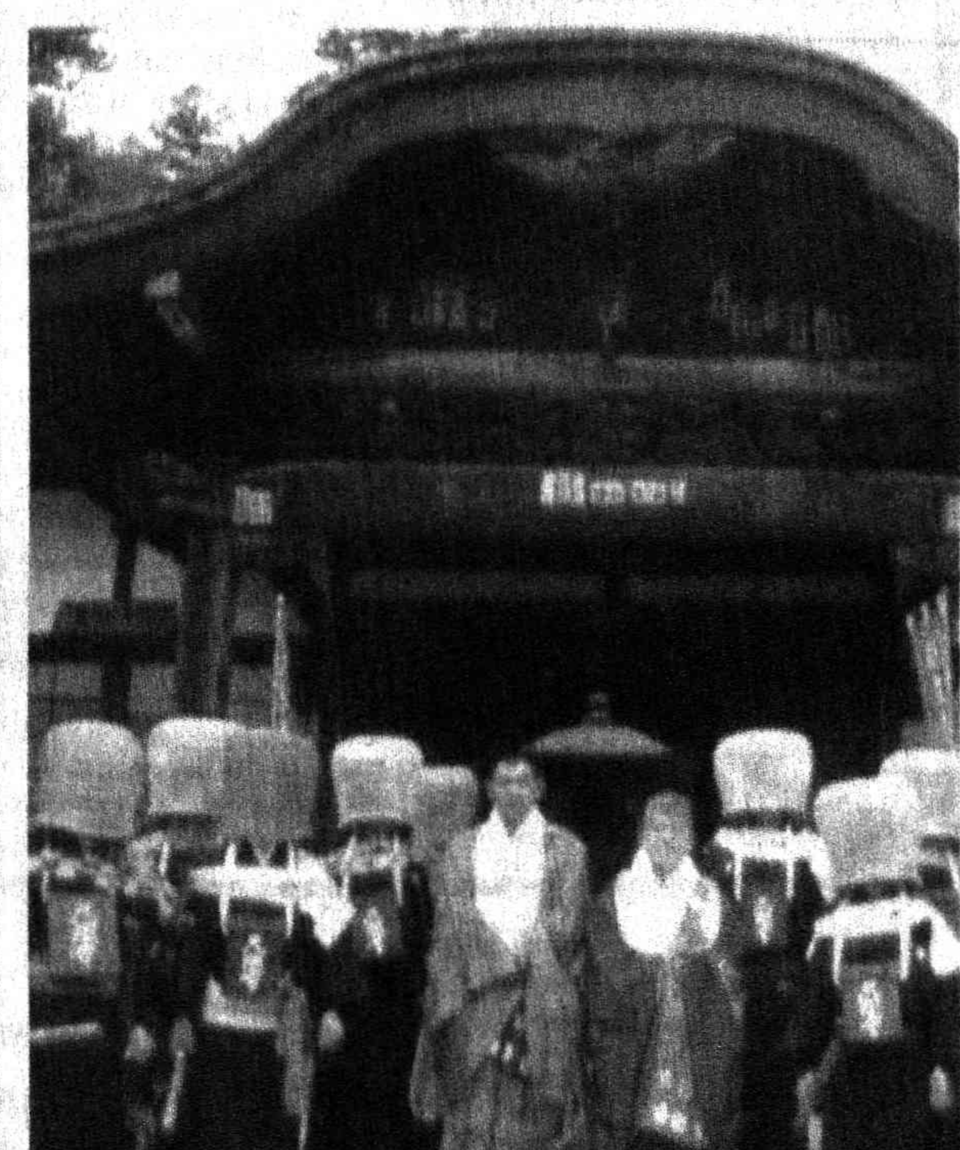
ПО СТРАНАМ МИРА. Япония. Буддистский монастырь Отогэ. На голове монахи носят... большие корзины, чтобы избежать мирских соблазнов.

Для этого 14 представителей законодательной власти Европы побывали на объектах здравоохранения и так называемом «атомном озере», образовавшемся в результате одного из наземных ядерных взрывов.