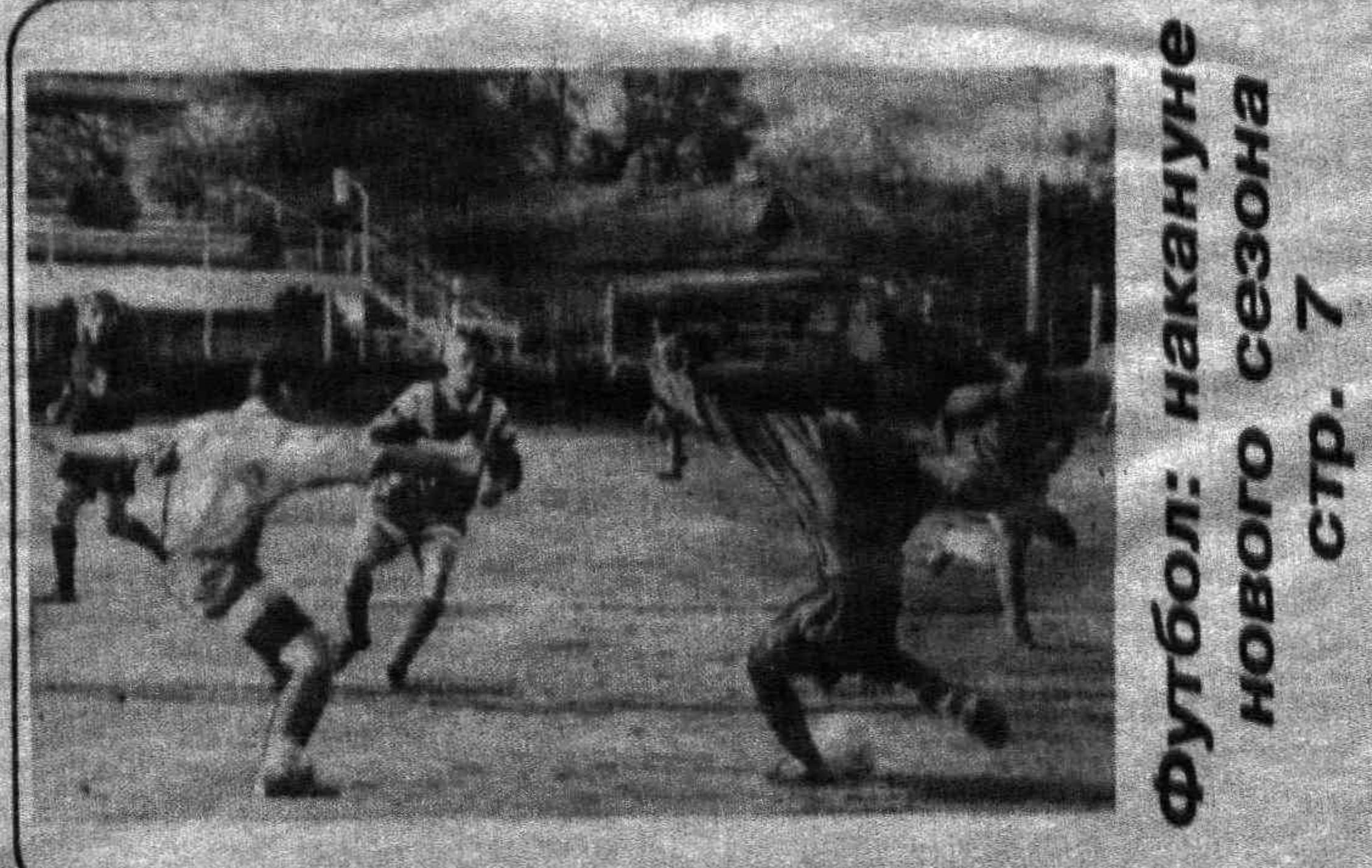
Футбол: накануне нового сезона стр. 7