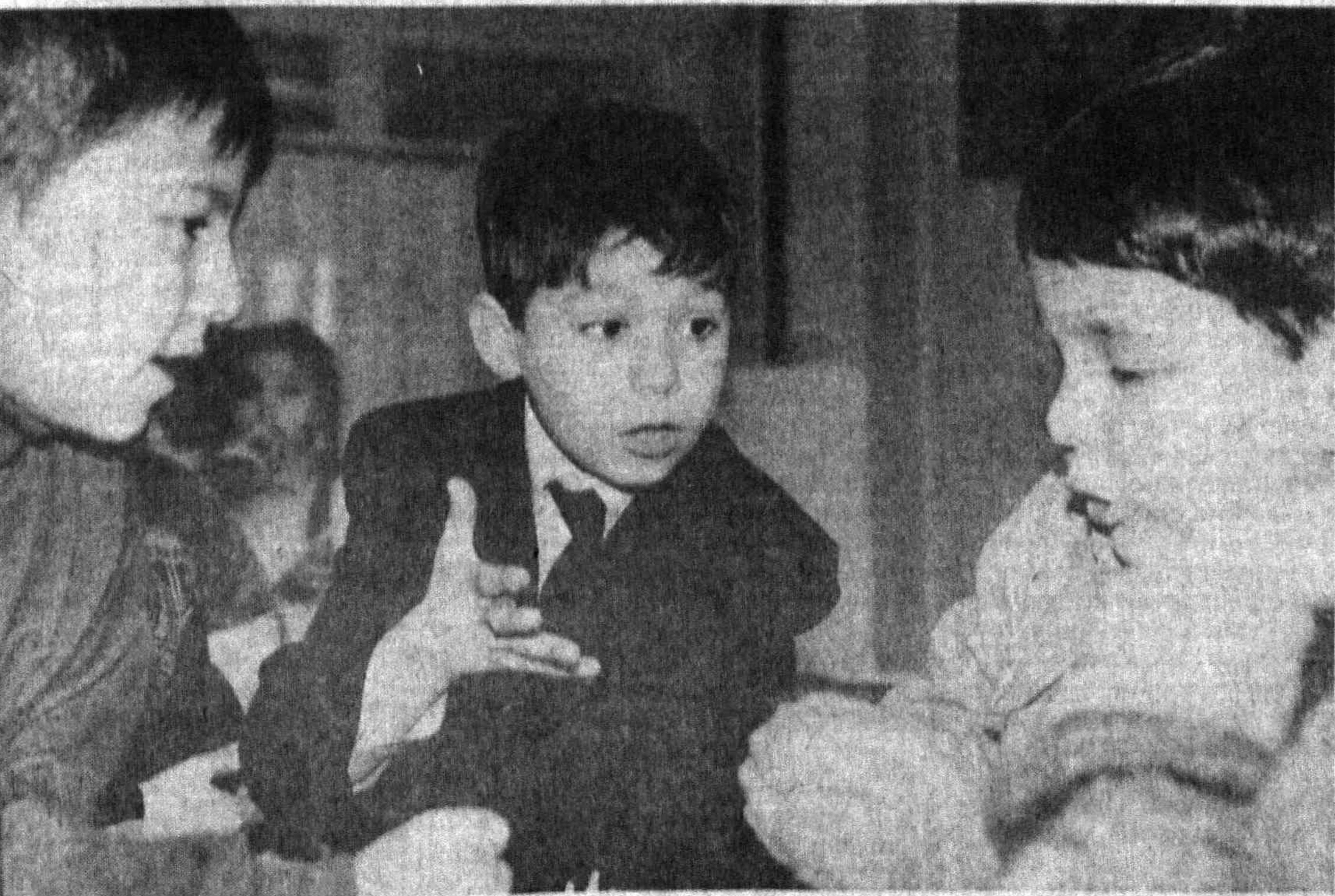
Эти снимки корреспондент Татьяна Кравченко сделала в 110-й ташкентской школе — одной из лучших в республике.