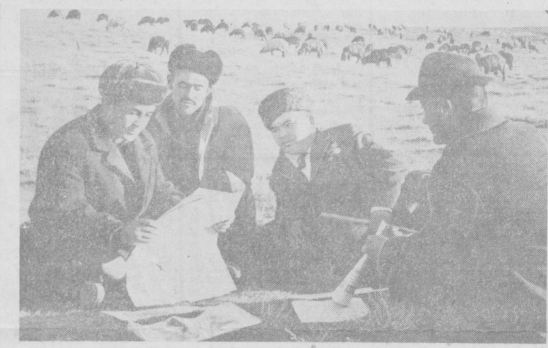
С большим вниманием прослушали чабаны совхоза имени Ахунбабаева Чиракчинского района новогоднее послание советскому народу, с которым выступил по радио и телевидению Генеральный секретарь ЦК КПСС тов. Л. И. Брежнев.