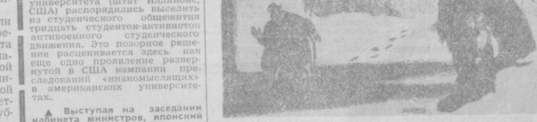
Этот широко известный рисунок Боба Мэйнера, изображающий безработного, вновь появился на страницах газеты «Канада» трибуна.

Выступая на заседании кабинета министров, японский премьер-министр С. Саэти вынужден был признать, что проблема роста цен является трудной для разрешения.