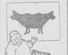
Пожалуйста, люблю часты.