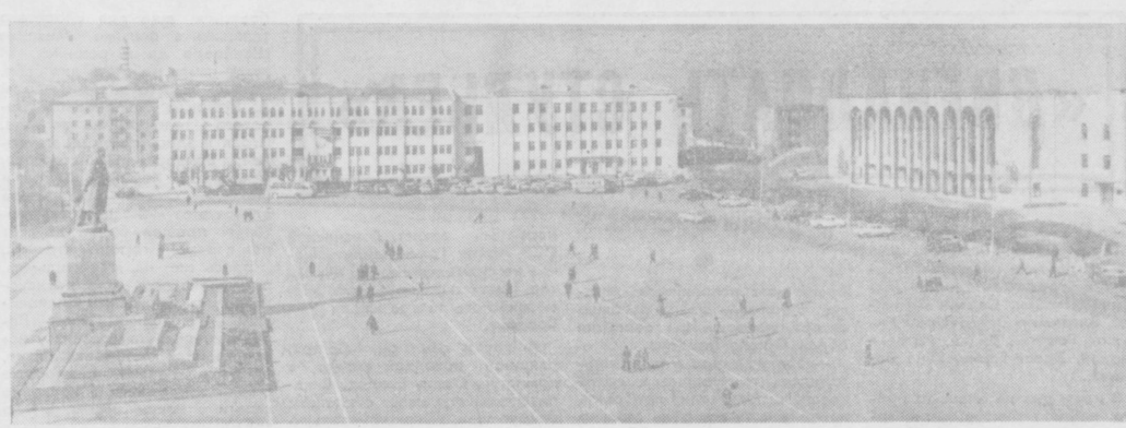
Мажачкала. Площадь имени В. И. Ленина.

НАУЧНАЯ организация труда... где начала зарождаться с первых же лет Советской власти.