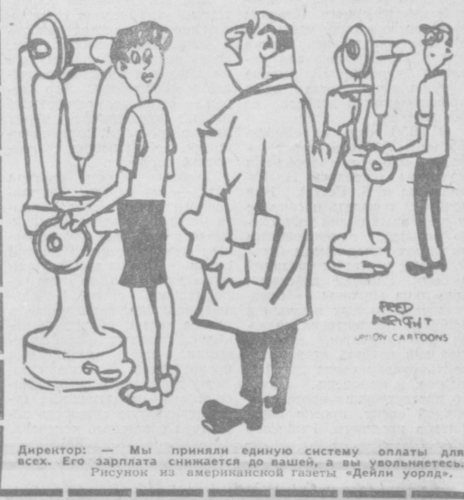
Директор: — Мы приняли единую систему оплаты для всех. Его зарплата снимается до востребования, а вы увольняетесь. Рисунок из американской газеты «Дейли уорлд».

Женщины во многих капиталистических странах получают более низкую зарплату, чем мужчины, за равный труд. (Из газет).