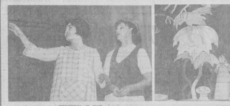
«Проснись и пой».