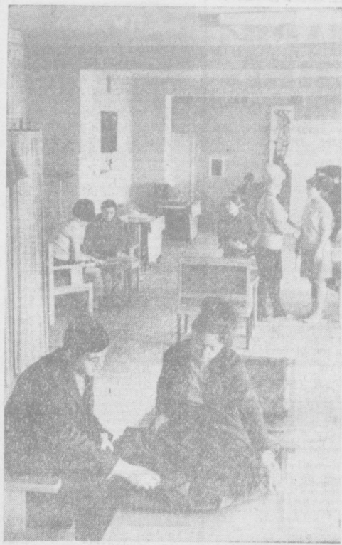
В Ташкенте при швейной фабрике имени Ленина открыт Дом моды. Здесь всегда многолюдно. На снимке: в демонстрационном зале.