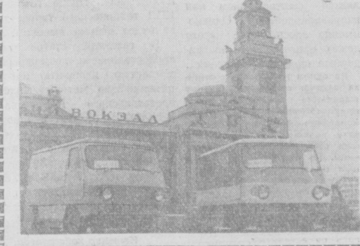
МОСКВА. Коллективом Всесоюзного научно-исследовательского института электромеханики сконструирован опытный образец электромобиля. Подзарядка аккумулятора производится от сети переменного тока городской электросистемы. Электромобиль развивает скорость до 60 километров в час. На первом снимке: электромобили на площади Киевского вокзала. На втором снимке: электромобиль в строю действующей второй очереди 3-го рудоуправления солигорского комбината «Белорусский». На третьем снимке: общий вид отделочного цеха саванно-обезьячьей фабрики.

Советская сторона вновь заявила о своей поддержке и готовности оказать помощь в осуществлении справедливого и прочного мира на Ближнем Востоке.