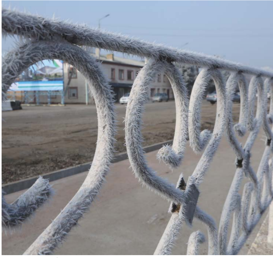
Гулқорӣи табиӣи фасли сармо.

Далер АЗИЗОВ, хабарнигори «Овози тоҷик».