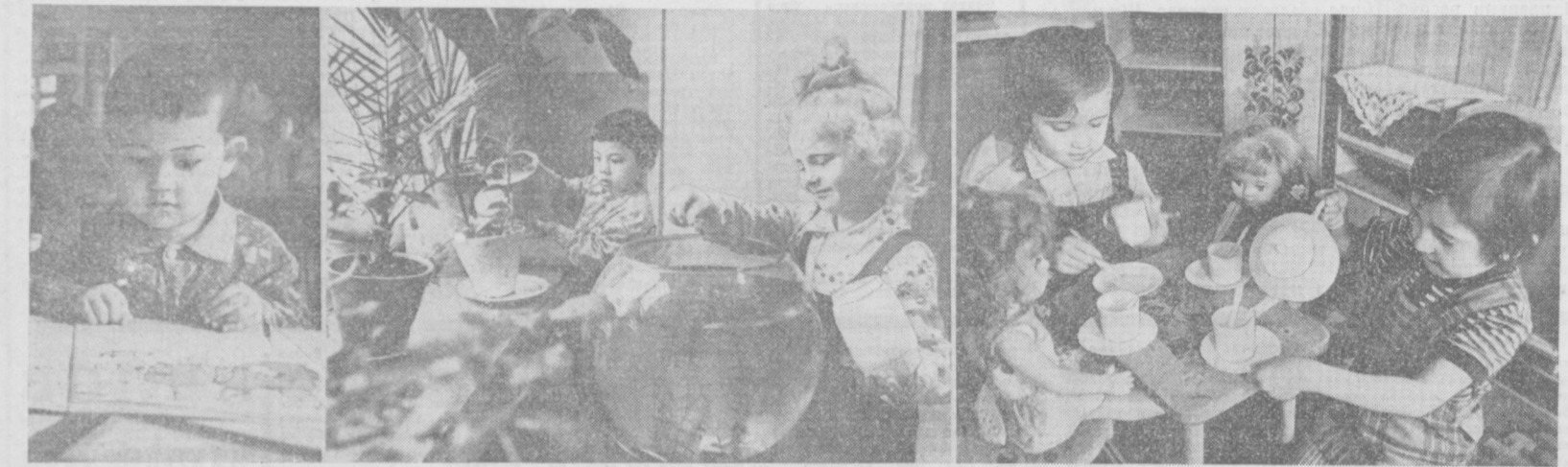
1979 йил — ХАЛҚАРО БОЛАЛАР ЙИЛИ. Тошкент гушт қомбинати қошидаги болалар боғчасида кичкинтойларнинг соғлом ва ҳар томонлама тарбияси учун мажмуи шарт-шароитлар яратилган...