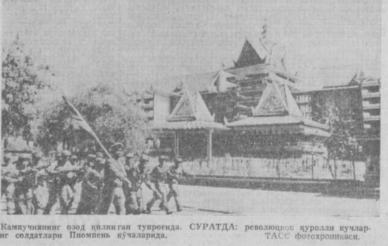
Кампучиянинг овоз қилинган туғроғида. СУРАТДА: революция қурол кучларининг солдатлари Пномпень кўчаларида. ТАСС фотохрониси.

АДДИС-АБЕБА, 1 фев-раль. (ТАСС). Инсониятнинг келажаги чинакам қуролсиз-ланиши амалга ошириш-ни таъминлашда КХР Бириш-ган Миллатлар Ташкилотига ва унинг махсус таъкилот-ларига ўзининг доимий ва-киллари юборди. Халқ Революция Кенга-шига БМТнинг махсус таъкилотларига ва бошқа халқаро таъкилотларда Кам-пучия вақилларини таъмин-лаш ҳукувчига эгадир. Ҳеч ким БМТда, унинг махсус таъкилотлари ва барча ҳақ-қаро таъкилотларида Кам-пучия номидан иш қўриш ва-қолига эга эмас. Хун Сен шу мактубин БМТ Бош асабамбленини ҳўжжати сифатида тар-тиб-тишши илтимос қилди. Тошонлар мустамлақчи-лик, ирқчиллик ва алартед-ни тағ-томири билан тeрроқ-туғатиш учун куч-гайратни янада активлаштириш ло-зимилиги ҳам билдири-лар. Улар Жанубий Африка Республикаси ва Родезия ирқчи режимиларнинг Ан-гола, Ботсвана, Мозамби-к ва Замбияга қарши агрес-сия-ни қоралашди.