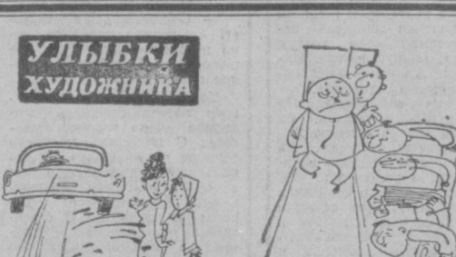
— Ты заметила, как он посмотрел на меня! — Вечно он оригинальничает!

Шли годы, десятилетия, века. Всею есть свой срок. И однажды люди заметили, что красавец-минарет накренился.