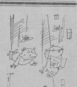
— Ну как, дом прини-маем? — Вечно он оригинальничает!