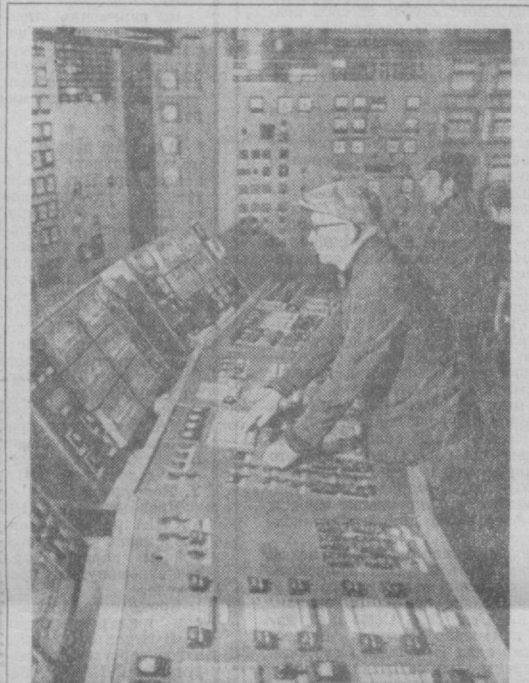
Как уже сообщалось, первый агрегат одной из крупнейших тепловых электростанций Советского Союза, строящейся в центре Голодной степи Узбекистана...