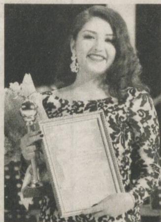
Навқирон авлод сўзи