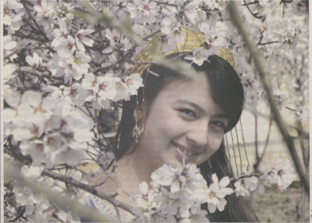
“Ҳар баҳорда шу бўлар такрор...”