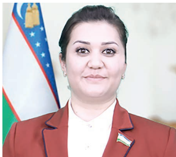
Мадина БАРАТОВА, Олий Мажлис Қонунчилик палатаси депутати, O'zLiDeP фракцияси аъзоси:

Мазкур қонун лойиҳасининг қабул қилиниши бизнес субъектларининг қонуний манфаатларини ҳимоя қилишнинг ҳуқуқий чораларини кучайтиришга имкон яратиши билан бирга, мулк ҳуқуқи дахлсизлиги таъминлишига ҳам хизмат қилади.