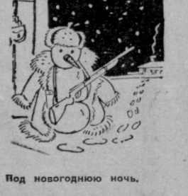
Под новогоднюю ночь.