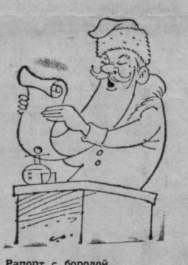
Рапорт с бородой.