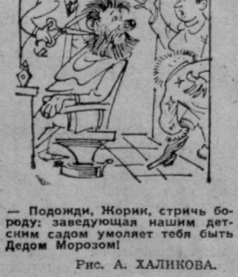
Подожди, Жорин, стричь бороду: заведующая нашим детским садом умоляет тебя быть Дедом Морозом!