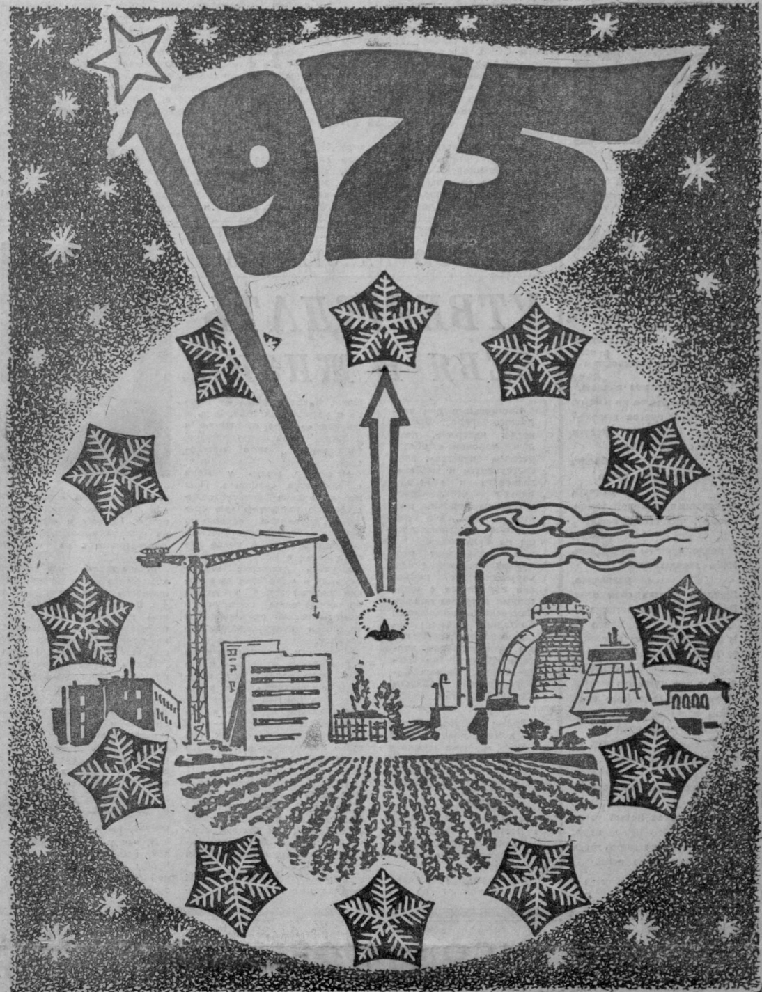
Рис. Р. ЛЕВИЦКОГО.

Год будущий должен подвести итог работы, проделанной по выполнению решений XXIV съезда КПСС, и в то же время заложить основы для успешной работы в 10-й пятилетке. 1975 год — год подготовки к очередному, XXV съезду партии. Это заставляет нас с особой ответственностью подходить к выполнению планов будущего года, одобренных декабрьским (1974 г.) Пленумом ЦК КПСС и утвержденных недавней сессией Верховного Совета СССР.