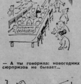
А ты говорила: новогодних сюрпризов не бывает...