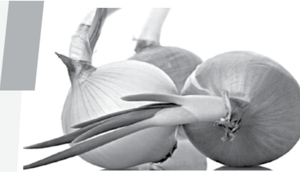
Бугунги кунда аёллар ўртасида шундай гап-сузлар эшитсангиз, ажабланманг. Ҳақиқатан ҳам, шу кунларда рўзғорда энг кўп ишлатиладиган пиёзнинг нархи кўтарилган. Айниқса, юртимизда қарийб 20 кун давом этган аномал совуқ туфайли пиёз янада қимматлашди.

Бу гапдан келин кўлидаги пиёзни арчишга ҳам иккиланиб, доғдираб қолди.