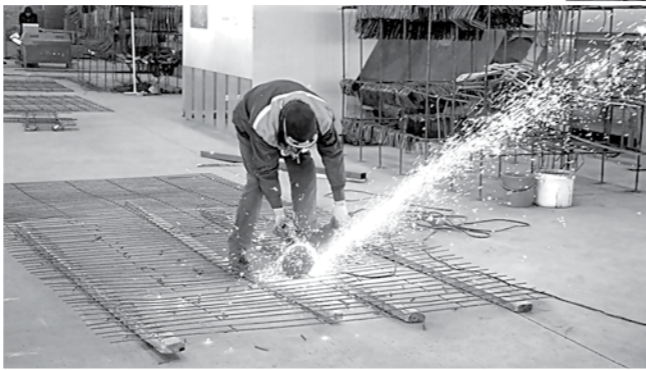
(Давоми. Бошланиши 1-саҳифада)

тонна тош майдалаш, яна шунча асфальт тайёрлаш қувватига эга. Бу ерда, шунингдек, ички ва ташқи эшиклар, дераза ромлари, мебеллар ҳам