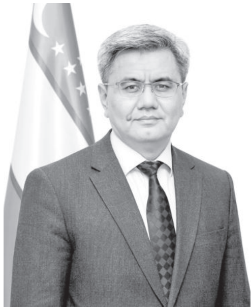
Обид Хакимов. Директор Центра экономических исследований и реформ при Администрации Президента Республики Узбекистан.