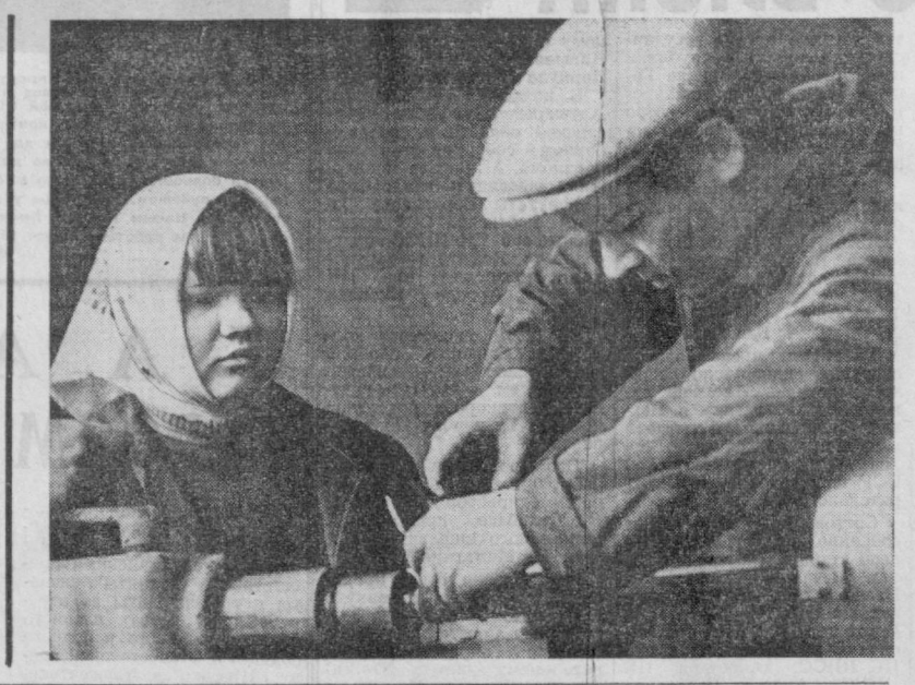
Подготовка к выборам в Каракалпакии

На постоянно действующих межреспубликанских курсах по переподготовке партийных и советских работников состоялся очередной выпуск слушателей. В их числе были руководители предприятий промышленности, связи, торговли, материально-технического снабжения, сельского хозяйства, начальники отделов кадров министерств и ведомств, председатели районных и городских плановых комиссий из республик Средней Азии. В ходе занятий слушатели изучали актуальные проблемы марксистско-ленинской