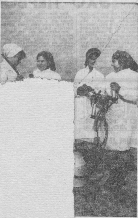
Члены совхоза «Дальварзин-1»...