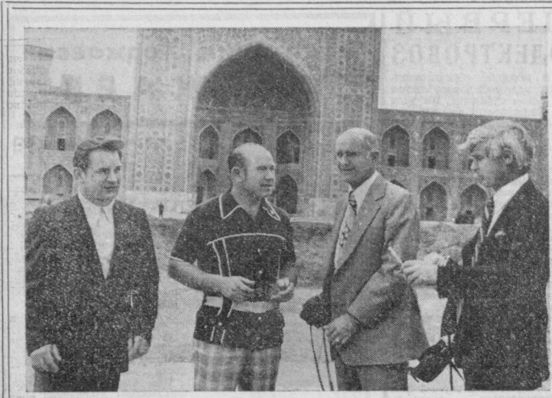
На снимке: советские космонавты Валерий Кубасов и Алексей Леонов, американские астронавты Томас Стаффорд и Юджин Сернан на площади Регистан в Самарканде.