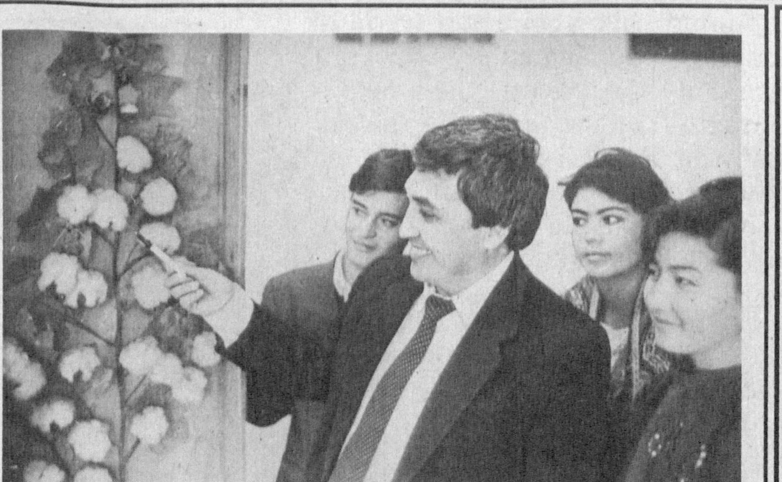
Гафур Фулом номидаги Гулистон давлат университетини қошида очилган янги факультетларда маркетинг ва бошқариш, бухгалтерлик ҳисоби ва аудиторлик соҳаларини ўқитишга алоҳида аҳамият берилаяпти. Бу ерда Тошкентдаги олий ўқув юртиридан тез-тез тақлиф қилинаётган мадакал мутахассис ва олимлар ҳам лекциялар ўқийлапти. Яқинда университет қошида тил ўра-