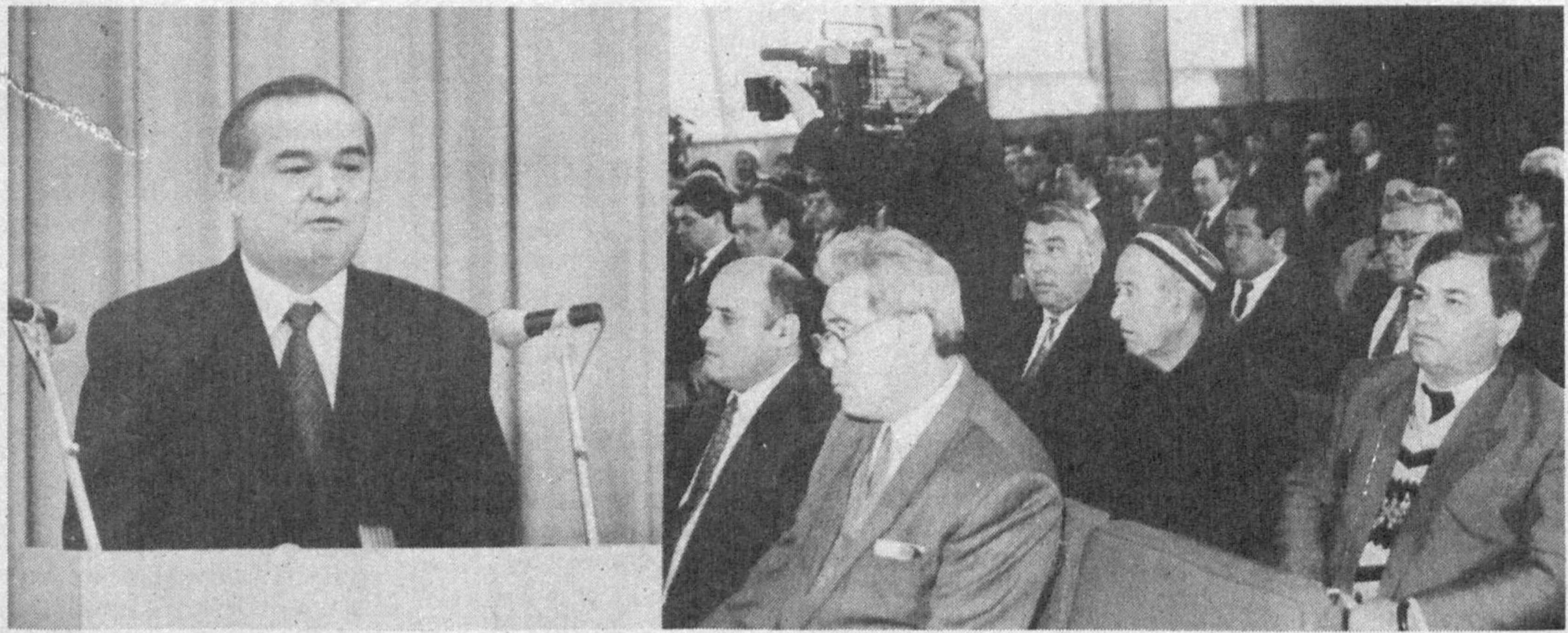
СУРАТЛАРДА: сессия залидан лавҳалар.

9 январь куни халқ депутатлари Тошкент вилоят кенгашининг биринчи сессияси бўлди. Унда 1994 йил якунлари ҳамда вилоятни ижтимоий-иқтисодий ривожлантириш борасидаги вазифалар муҳокама этилди. Сессияда Республика Президенти Ислоҳ Каримов нутқ сўзлади.