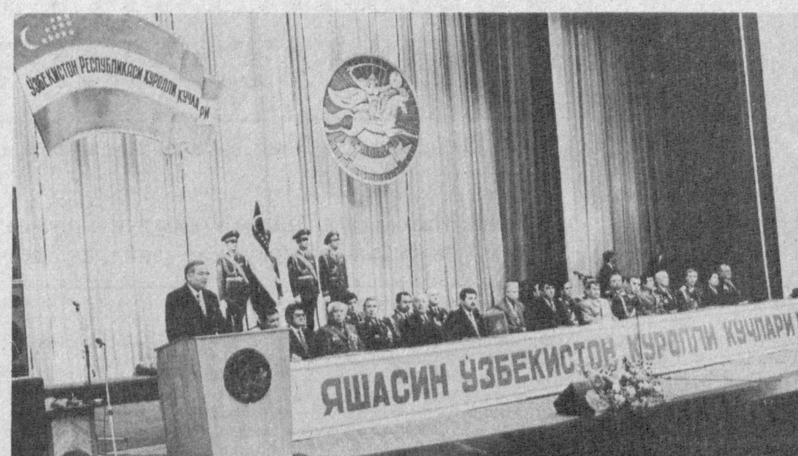
СУРАТДА: тантанали йиғилиш пайти.

Пойтахтнинг ҳашаматли «Туркистон» саройи 13 январь кунини ҳар кўнгида давлат байрамлари билан бири — Ватан ҳимоячилари кўнига бағишланган тантанали йиғилиш муносабати билан саройга республика Қуроли Кучлари офицерлари, аскар ва курсантлар, уруш ва меҳнат фахрийлари, пойтахт жамоатчилиги вакиллари, хорижлик меҳмонлар ташриф буюрдилар. Ўзбекистон Республикаси Президенти — мамлакат Қуроли Кучлари бош қўмондонини Ислам Каримов ва ҳукумат раҳбарлари, Қуроли Кучлар генераллари, фахрийлари минбардан жой олдилар. Тошкент шаҳри ҳокими Козим Тулаганов йиғилишни очиб деб эълон қилди. Мустақил давлатимиз мадҳияси янгради. Ўзбекистон Республикаси мудофаа вазири генерал-лейтенант Рустам Аҳмедов мамлакат Қуроли Кучлари ташкил топган куннинг уч йиллиги тўғрисида маъруза қилди. Республика Президенти Ислам Каримов табрик нутқи сўзлади. Ўртабшимиз мамлакат Қуроли Кучлари шахсий таркибини — курсант, аскар, зобит ва генераллари, уруш фахрийларини Ватан ҳимоячилари кўни байрами билан самимий кўталади. Бугун юртимизда жуда катта байрам — Ватан ҳимоячилари кўни нишонланмоқда, — деди Ислам Каримов. — Бу сана гоёт муҳим ва шарафлидир. Халқимиз илгаридан мард ўғлонларни тарбиялашга аҳамият бер-