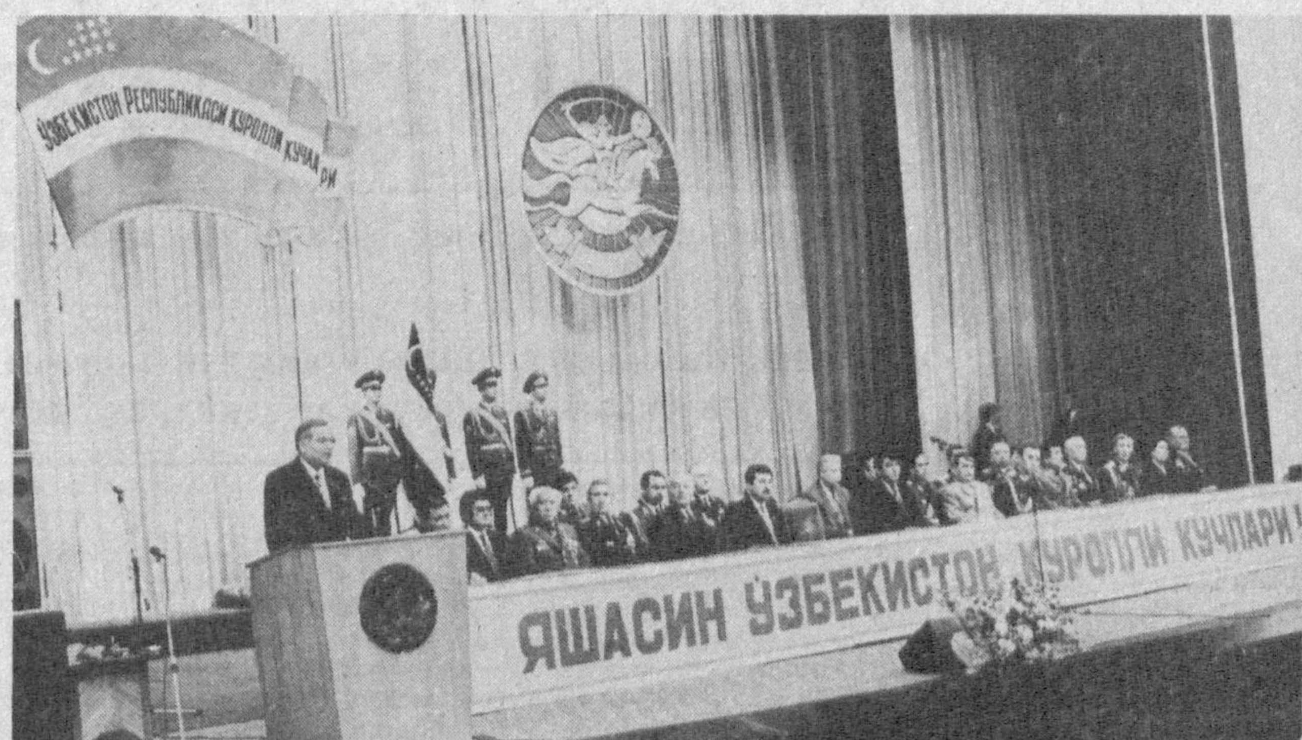
СУРАТДА: тантанали йиғилиш пайти.

— Бугун юртимизда жуда катта байрам — Ватан ҳимоячилари кўни нишонланмоқда, — деди Ислам Каримов. — Бу сана гоёт муҳим ва шарафлидир. Халқимиз илгаридан мард ўғлонларни тарбиялашга аҳамият бер-