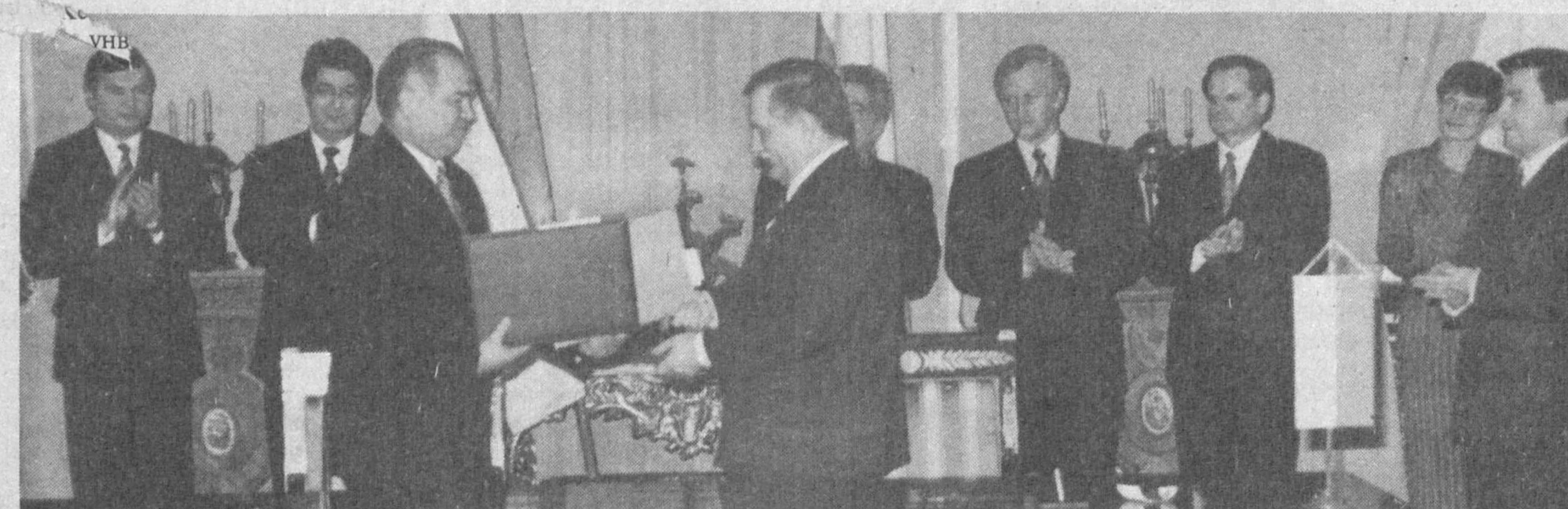
СУРАТДА: икки томонлама ҳужжатларни имзолаш маросими.