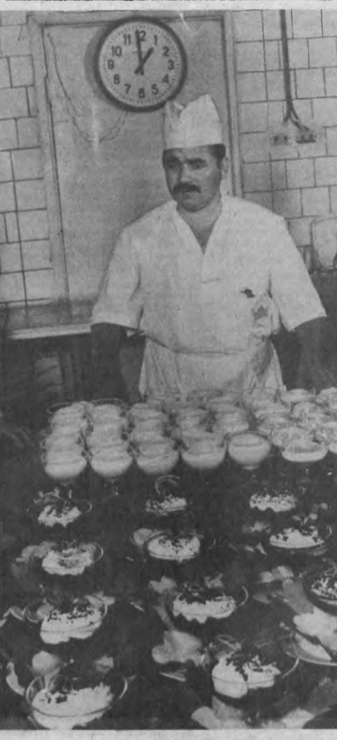
Дақиқани ғанимат била.

нувчиларнинг қадами тортилади. Чунки, салқинда қўрилиш, балчиққа тушиб учун широт йўли. «Қарши-стройиндустрия» бирлашмаси бунинг иложини топди. Бирлашма ўз профилактикаси учун ҳар кун Хўжайнак сувидан машинада келтиришни йўлга қўйди. Сув махсус идишларда иситилгач, ванналарга узатилапти.