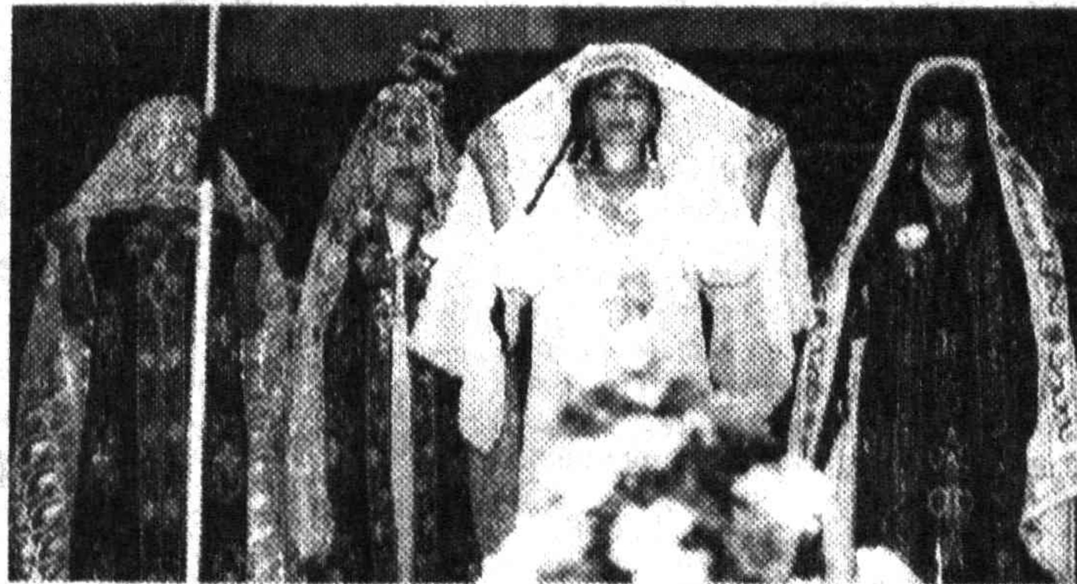
На снимке: на конкурсе.