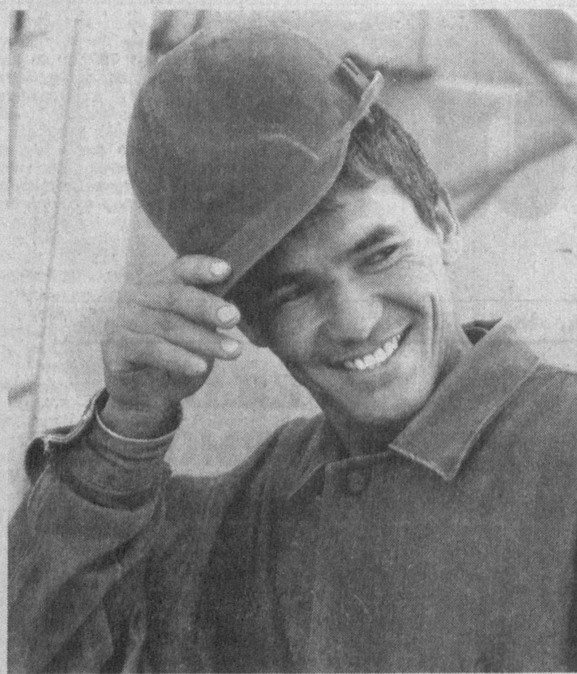
(Давоми. Боши 1-бетда).

Лекин ўша даврда фақат Тошкент, Фарғона, Андижон, Бухоро ва Наманган шаҳарларида пахтани қайта ишлайдиган корхоналар бўлиб, уларга хомашёнинг бор-йўғи 8 фоизи қолдирилди, қолгани сувтекин баҳосида Марказга ташиб кетиларди. «Бўзчи белбоққа ёлчимас» деганларидек, йил — ўн икки ой далада пешона тери тўкиб, тонна-тонналаб «оқ олтин» етиштирган ўзбек деҳқонининг эғни оддий чидан тикилган кийим-кечакларни ҳам кўрмас эди.